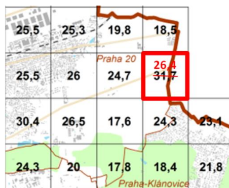
Pětiletý průměr 2009 – 2013

Pětiletý průměr 2009 – 2013: 31,7 → 26,4